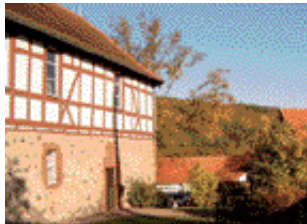
Fachwerkkirche in Oberorke

Von Dalwigkthal geht es rechts am Eisenberg vorbei bis zur Schutzhütte und dann weiter bis zum Lohkopf. Dann rechts abbiegend zum Parkplatz und weiter nach Oberorke.