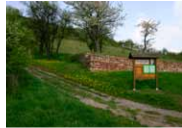
„Kalte Stelle“ bei Unterrißdorf