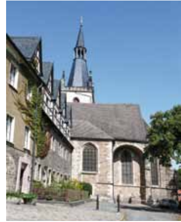
St. Annen-Kirche

Martin Luther erhielt bei seiner Taufe im Vorgängerbau der heutigen Petri-Pauli-Kirche am 11. November 1483 den Namen des Tagesheiligen. Die wuchtige Renaissancehaube des Turms prägt das Eisleber Petriviertel. In der Kirche beeindruckt das spätgotische Kreuz- und Netzgewölbe. Ab 2012 steht die Kirche als „Zentrum Taufe“ für alle Besucher offen. Dann wird neben dem historischen Taufstein im Zentrum der Kirche ein Ganzkörpertaufbecken den Raum bestimmen.