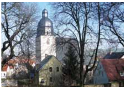
Kirche St. Petri und Pauli

Tipp: Hier beginnt der „Lutherweg Eisleben“, der die Lutherstätten in Eisleben miteinander verbindet. 144 im Pflaster eingelassene bronzene „Lutherrosen“ markieren den Weg.